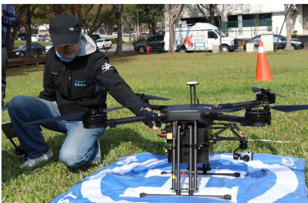
DJI 如風 4 (11+10Kg 載重, 105cm 軸距)